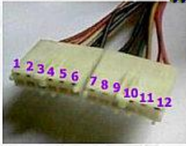
Connecteur d'une alimentation AT